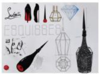
Sous la direction de Daphné Demuth