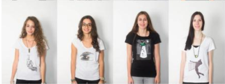
Sous la direction de Daphné Demuth