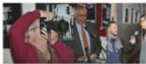
Exposition à partir du 12 novembre 2014 au 13 janvier 2015. Ouverture de la galerie du LGE à 19 heures.

Les artistes du Street Photography Luxembourg ont été invités à participer à l'exposition. Les artistes du Street Photography Luxembourg ont été invités à participer à l'exposition. Les artistes du Street Photography Luxembourg ont été invités à participer à l'exposition.