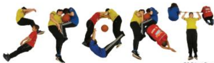
7.2 Ed. art. Demuth Daphné