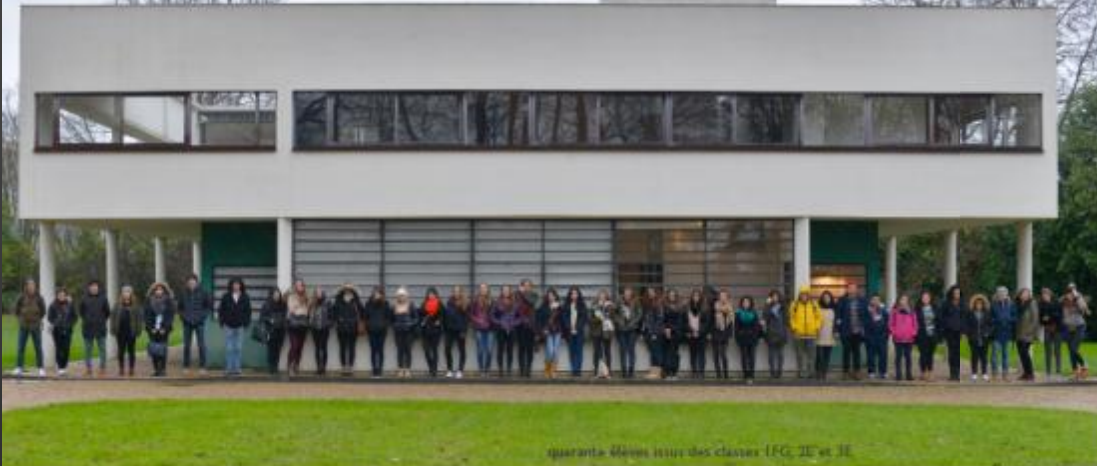
quarante élèves issus des classes IFG, 2E et 3E